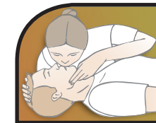
Respiración de rescate (si observa una sobredosis)