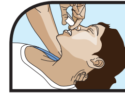
Aerosol Nasal (4 mg)