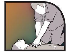
Compresiones torácicas (si no observa el colapso)